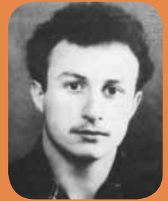
(1934-1960) ქართველი მწერალი, სულ რამდენიმე ნელს იღვანა სამწერლო ასპარეზზე.