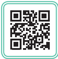
Արկտիկայի զեկուցագիր https://goo.su/UYbeMoq