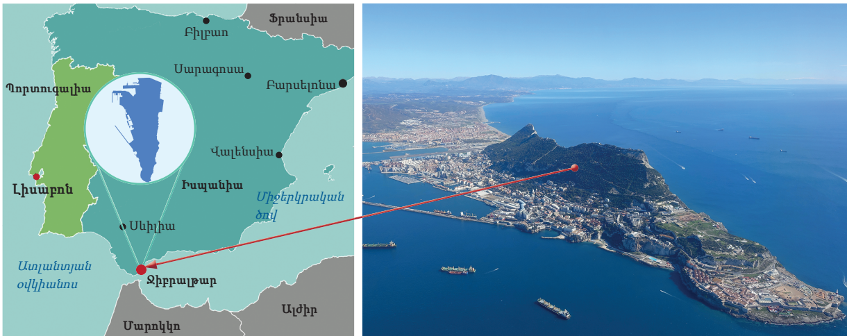
Նկ. 9.3. Ջիբրալթարը միակ կախյալ տարածքն է Եվրոպայում: Այն պատկանում է Միացյալ Թագավորությանը: Այս տարածքը պատմականորեն կարևոր ռազմական հենակայան էր Բրիտանիայի համար և այսօր էլ այդպես է: Ջիբրալթարի անկախությունը բրիտանա-իսպանական հարաբերությունների հիմնական հարցերից մեկն է: Իսպանիան 1713 թվականին անջատված տարածքի վերադարձ է պահանջում, բայց փոխանցման ամեն փորձին գրեթե միաձայն դեմ են ջիբրալթարցիները:

Աշխարհում ներկայումս գոյություն ունեցող կախյալ տարածքների մակերեսը կազմում է ցամաքի 1%-ից պակաս: