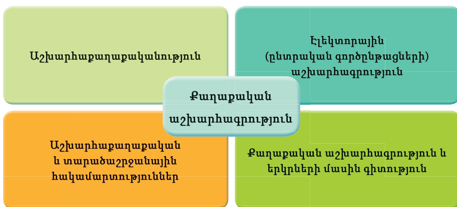
Նկ.9.4. Քաղաքական աշխարհագրության հիմնական ուղղությունները

Ուսումնասիրվող օբյեկտների մեծաքանակության հետ մեկտեղ՝ քաղաքական աշխարհագրության մեջ ձևավորվել են մի քանի հիմնական ուղղություններ, որոնք ներկայումս դինամիկ զարգանում են: