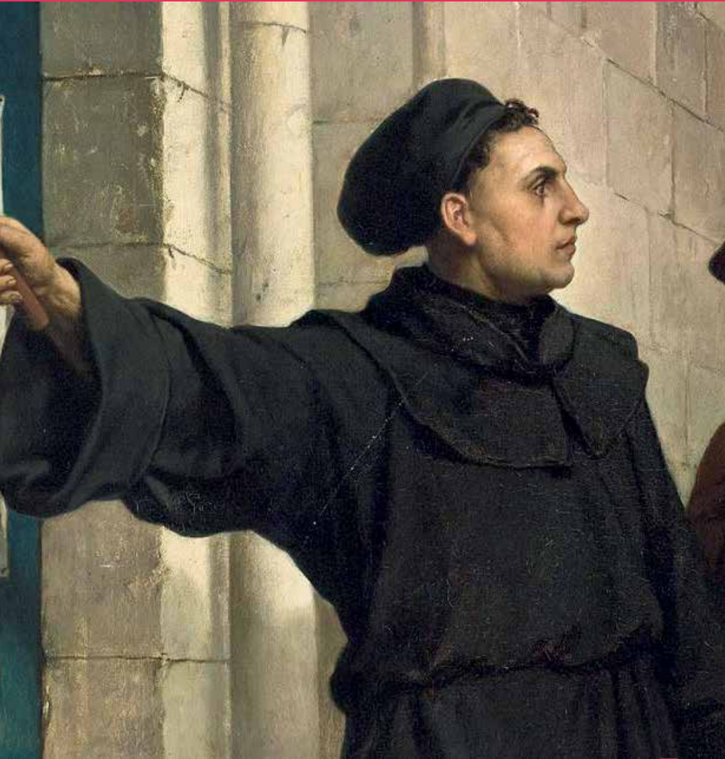
Martin Lüter Vittenberq kilsəsinin qapısına 95 tezis asır.