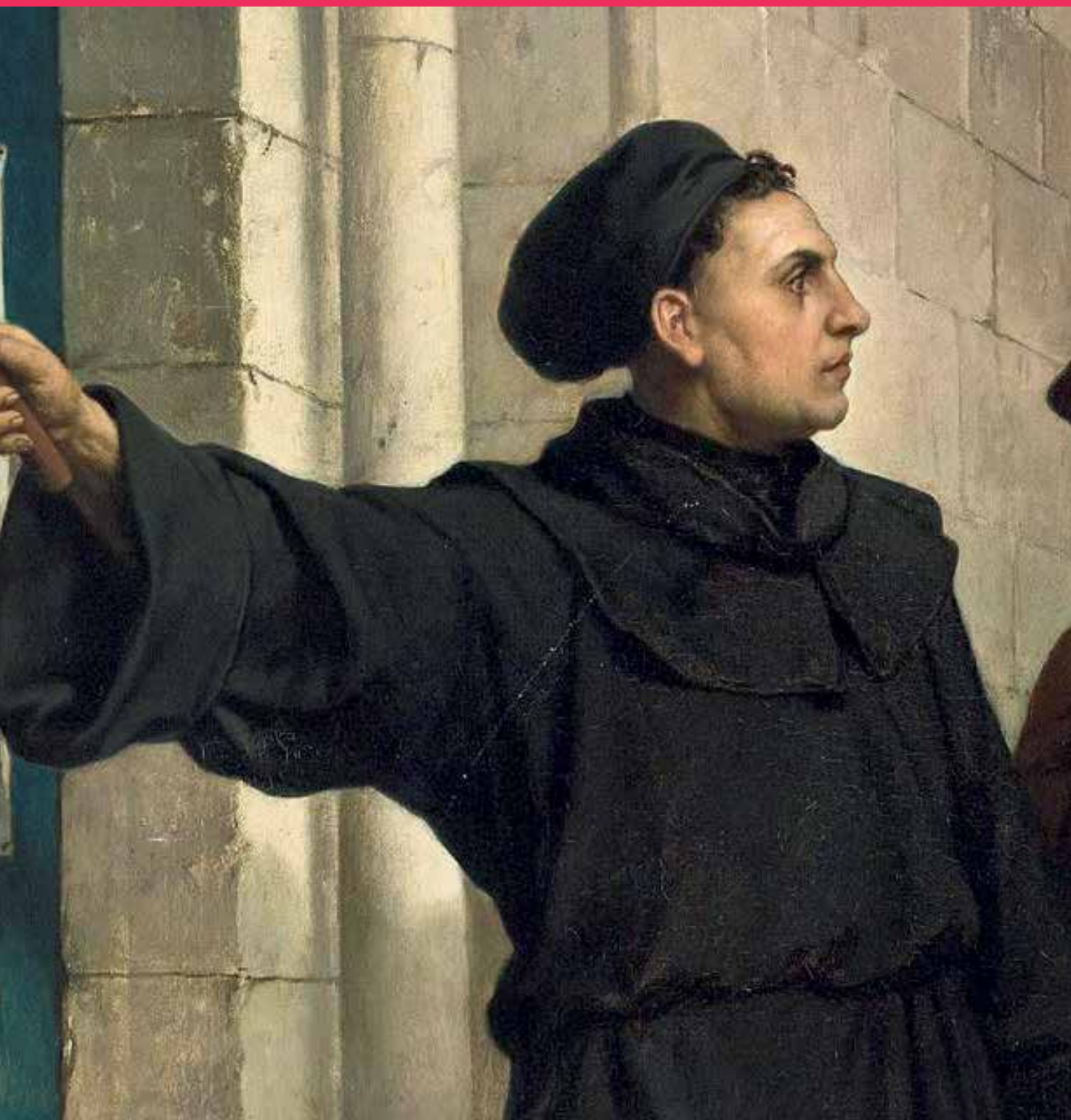
Мартин Лютер прибывает 95 тезисов к двери Виттенбергской церкви.