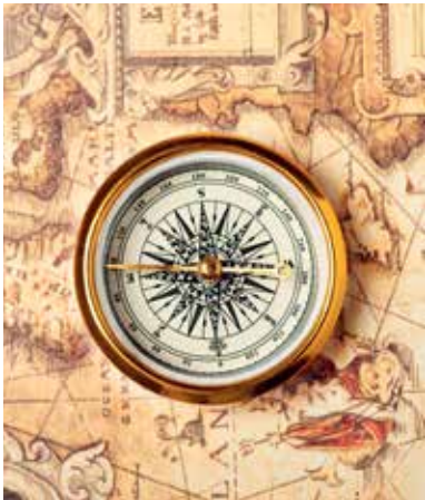
Կողմնացույց – ճանապարհորդների անբաժանելի ատրիբուտ

Ուշադիր կարդա՛ դասագրքում ներկայացված պարագրաֆները, որոնցում նկարագրված են XV-XVI դարերի կարևոր իրադարձություններ և գործընթացներ: Ստեղծի՛ր Ժամանակային գիծ , որում ժամանակագրական հաջորդականությամբ կներկայացնես յուրաքանչյուր պարագրաֆից, ըստ քեզ, ամենակարևոր պատմական իրադարձությունը՝ դրա մասին բերված աղբյուրի մատնանշմամբ: