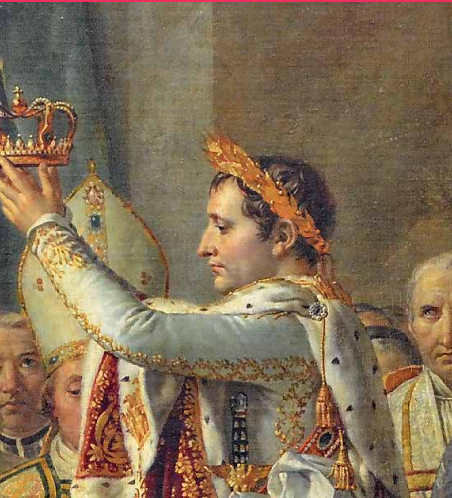
Коронация Наполеона Бонапарта