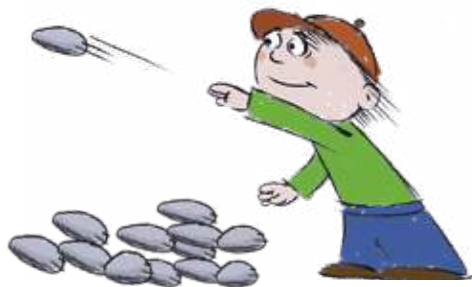
ბიჭმა ქვა ისროლა.