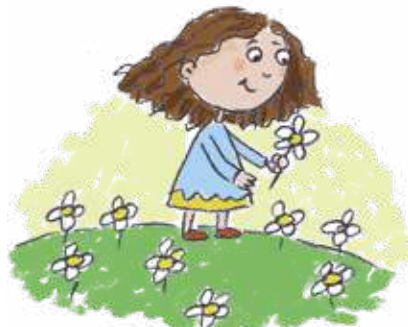
გოგონამ გვირილა მონყვიტა.

ბიჭი და გოგონა სულიერი არსებითი სახელებია. მათ მოქმედება შეუძლიათ!